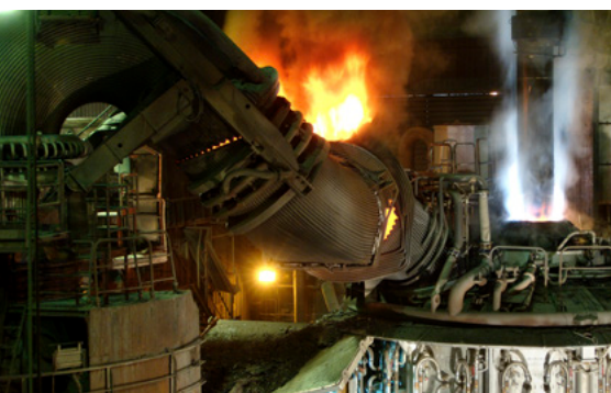
Schmelzvorgang in Georgsmarienhütte

Auf unserem großen und modern ausgestatteten Firmengelände in Oldenburg können wir sämtliche Anforderungen für den Weitertransport und die Endverwertung umsetzen. Sortierung, Zerkleinerung und Zwischenlagerung erfolgen selbstverständlich