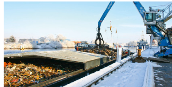
Fester Griff für schnellen Durchsatz

große Schrottschere mit 800 Tonnen Schneidekraft zum Einsatz, bei der wir durch eigene Verbesserungen den Durchsatz noch um 25 % steigern konnten. Unser großer Fuhrpark mit zwölf Schwerlast-LKW, zum Teil mit Ladekran, ermöglicht uns gleichzeitig eine effektive und flexible Logistik.